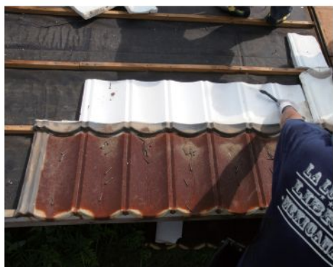
写真 (左) 提供: 通気下地屋根構法の設計施工要領作成TG